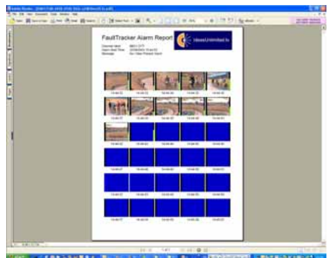
図3・レポートファイル出力機能 ( PDF ) アラーム発生箇所をサムネイル形式でレポート出力可能