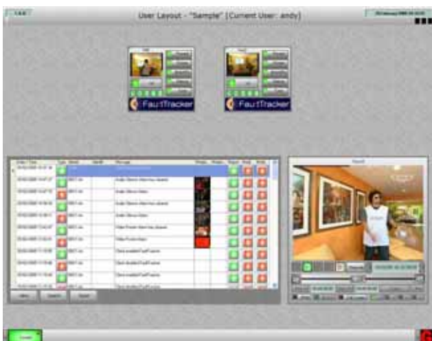
図2・ユーザーインターフェース例 複数チャンネルの送出を収録・監視が可能です。 ( 1サーバあたり1ch ~ 4chまで )